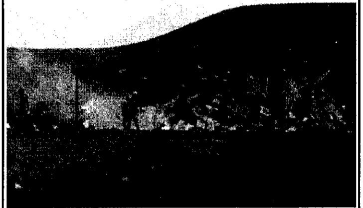
En el basural se arrojan los residuos patológicos

Puntualizó Pérez que el horno incinerador del hospital quedó fuera de servicio porque se mal utilizó, ya que no se quemaban únicamente residuos patológicos, sino además cualquier otro tipo de elementos.