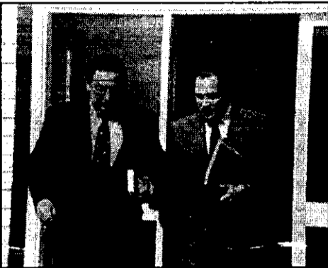
En la parte resolutive el juez Rodríguez condenó a Castro Feijoo a un año de prisión en suspenso

Cabe indicar que luego de concluido el juicio, varios periodistas que estaban en la