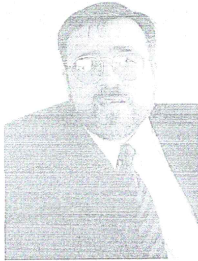
Tierra del Fuego, miércoles 20 de marzo de 2002

El consul niega que chilenos y argentinos estén susceptibles ante cuestiones como las que originó esta nota: "Creo que están más susceptibles por los problemas reales que tienen las dos naciones: empleo, superación de la pobreza, por el desarrollo; por problemas de salud, educación, vivienda..." y consideró que es absurdo suponer que un pequeño mapa, que no tiene ni el tamaño de una goma de borrar, despierte susceptibilidades entre los pueblos hermanos.