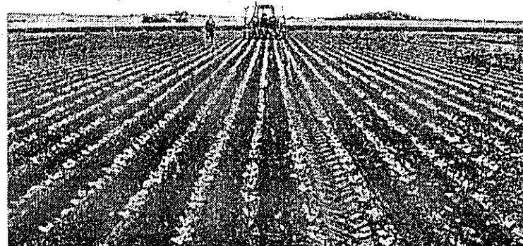
Los productos fitosanitarios están destinados al agro.